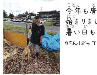
落ち葉もお金になるんです!!