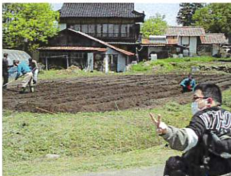
今年も唐辛子たくさん植えるよー

作業： 富士電子 (コルゲートカット) ヒロアイビル清掃 野菜作り 落ち葉集め PC文書、ラベル制作 唐辛子栽培 乾燥野菜事業など