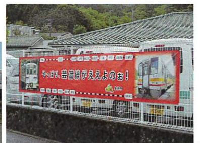
近くで見ると大きな横断幕