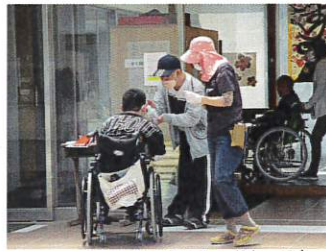
ただいまの消毒も自主的に

毎日のストレッチの後は、 軽作業や納品など その日の活動に分かれます 天気の良い日はお散歩に 行きます。