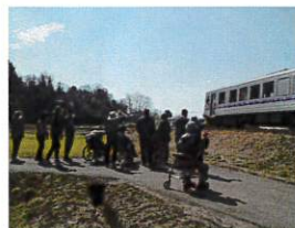
ときどきお客さんも手をふってくれます

いつまでも芸備線との交流が続いていこう かわせみの家も芸備線の存続を願っています。