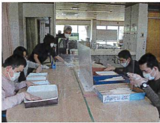
はし入れの作業をしています

作業： はし入れ ふろしきたたみ 乾燥野菜 納品 缶回収 ガスキンレンタル パイプハンガー 印刷など