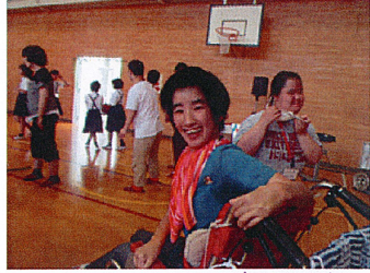
短い時間でしたが笑顔が絶えず たのしい交流会でした