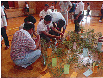
夕ささーのは〜 さ〜ら〜月