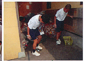
この体験を通して、将来に役立てられると いいですね