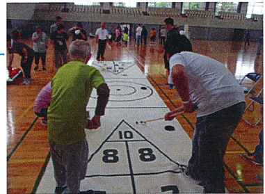
試合の空き時間を利用して。