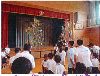
班ごとに飾り付けに世を披露☆

高小学校さんより七夕集会にお招きいただきました。 児童のみなさんとゲームにうたと楽しいひとときでした。