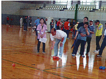
やる気ハワーが急上昇🔥