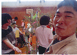
児童のみなさんと短冊や飾りをつけました☆願いが叶いますように☆